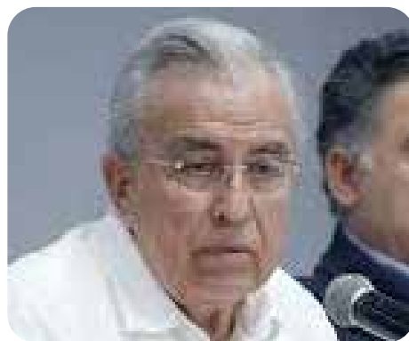
Rubén Rocha Moya