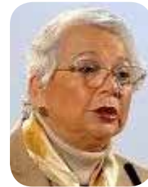
Olga Sánchez Cordero

El anuncio de Olga Sánchez Cordero sobre su retiro de la vida pública en 2027 no solo representa el cierre de una trayectoria política y jurídica de gran relevancia, sino también el fin de una generación de figuras que sirvieron como puente entre las instituciones tradicionales del Estado mexicano y el proyecto de transformación impulsado por Morena. Su paso por